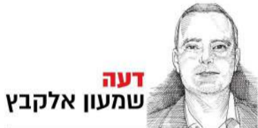
דעה שמעון אלקבץ

הגיע הזמן להפנים: המחלה המידבקת כאן לזמן ארוך. יש לחשוב לטווח ארוך, יש לקיים את החיים והכלכלה לצד הקורונה. זוהי פעילות במקביל, ולא בטור. אי אפשר להמתין לסיום הקורונה. הכלכלה תסתים לפני כן אם לא נפעל נכון. מניעת הירבקות היא מטרה ראויה, אבל סביר להניח שלא ניתן למנוע לאורך זמן את ההרבה, אלא יש לנהל נכון ולשלוט בקצב ההתפשטות שלה. לכן, יש להגדיר ראשית את המטרה ארוכת-הטווח, ויחד עימה לתת פתרון קצר-טווח לבעיות הפרנסה. למשל, טיפול מעמיק ושמירה על קבוצות הסיכון, ובמקביל הפעלת הכלכלה; או לימוד מעמיק של גורמי ההרבה המשמעותיים יותר, ומלחמה בהם תחילה.